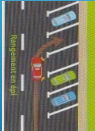
En épi avant